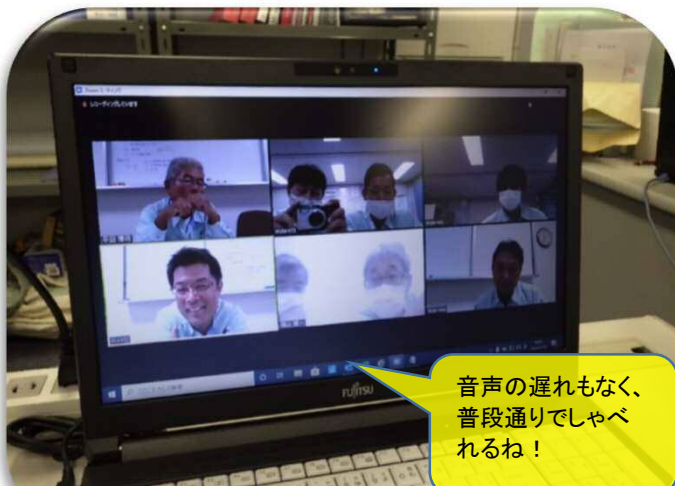
会話をしているときの画面

リモート技術を工夫して使えば、今後の「働き方改革」「生産性向上」にもつながる予感!! 是非、色々なアイデアを出して取り組んでほしいと思います(^ω^)...。(福山)