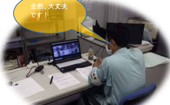
「筑後川水系(諸富地区)河川維持工事」現場事務所での様子