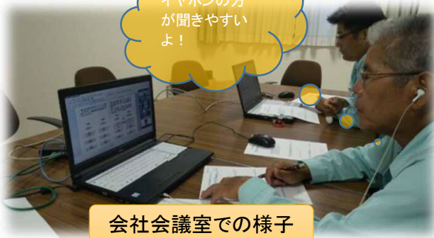
会社会議室での様子