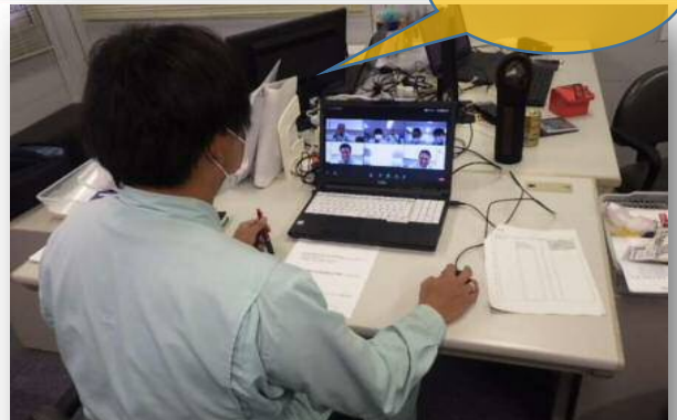
「元町地区外舗裝修繕工事」現場事務所での様子